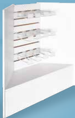
Mueble esquinero con ménsula