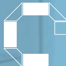
Isla de exhibición

Fabricadas en duraplay de 3/4" forradas de melamina color blanco ó negro, perfiles de aluminio con recubrimiento epóxico, ménsulas y cremalleras de acero cromado con cristales de 6mm de espesor.