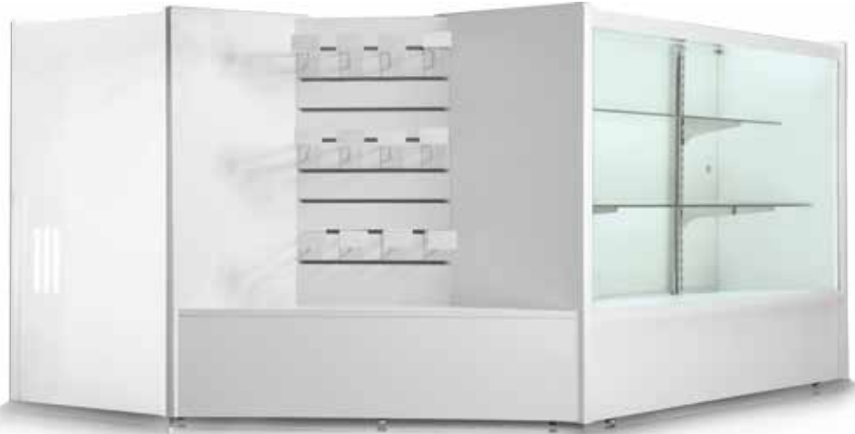
Vitrina de exhibición completa