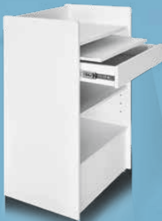
Mueble de caja