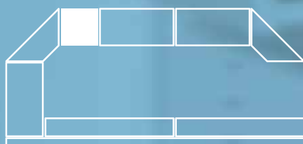
Media isla tipo mostrador